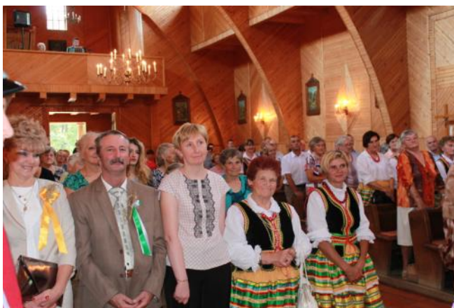
FOT. Uroczysta msza św. dożynkowa, która odbyła się w Kościele Filialnym w Pilaszkowicach pw. Najświętszego Serca Pana Jezusa (red.)