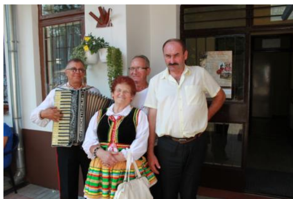
FOT. Dożynki gminne 2016 r. (red.)