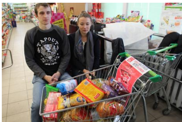
Wolontariusze podczas zbiórki Szlachetnej Paczki w Delikatesach Centrum