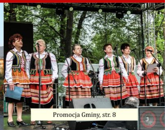
Promocja Gminy, str. 8