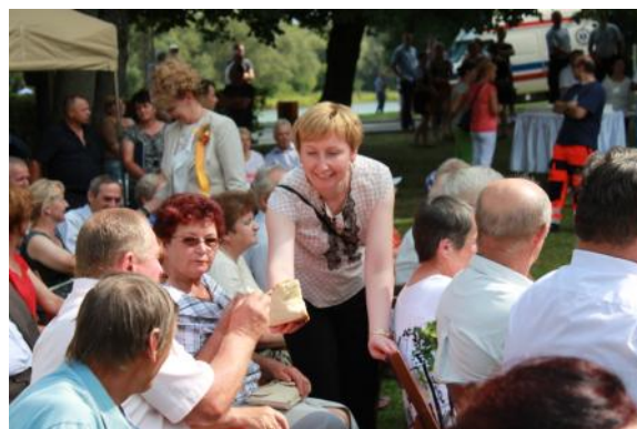
Dzielenie chleba podczas dożynek gminnych