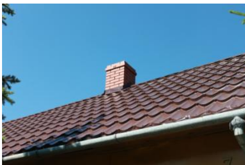
FOT. Inwestycja zrealizowana w ramach zadania Nowe Dachy (red.)

Wzięliśmy udział w tym projekcie również jako jednostka samorządu uzyskując 85% dofinansowanie do demontażu wyrobów zawierających azbest z budynków po byłym ZSO w Rybczewicach. Z uwagi na fakt, iż budynki po byłym ZSO są przeznaczone do rozbiórki, gruz będzie rozwożony na drogi gminne.