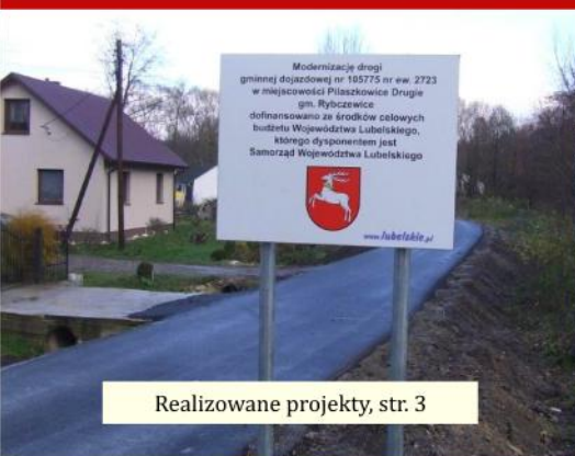
Realizowane projekty, str. 3