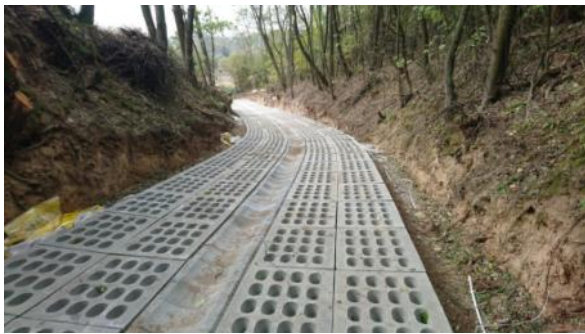
Wąwóz w Częstoborowicach

Jak informowaliśmy już Państwa w „Więściach z Rybczewic” w styczniu br. złożony został do Wojewódzkiego Programu Likwidacji Osuwisk i Ochrony Wąwozów Lessowych przed erozją projekt pt. „Utwardzenie dna i odwodnienie wąwozu lessowego w ciągu drogi gminnej nr 105762L od km 1+320 do km1+470 w miejscowości Częstoborowice”.