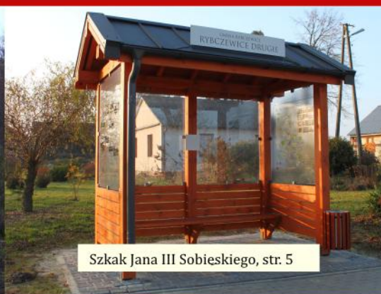
Szakak Jana III Sobieskiego, str. 5