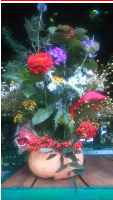
Bukiet ziół gm. Rybczewice poświęcony podczas II Lubelskiego Święta Ziół