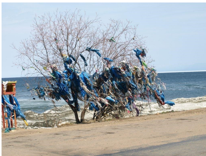
ZDJ. „Burchan nad Bajkałem”

W pewnym momencie moją uwagę przykuwa drzewo pokryte skrawkami różnobarwnych, głównie niebieskich szmatek. Sasza wyjaśnia nam, że jest to „Burchan” święte miejsce Buriatów, gdzie podróżny winien pozostawić drobną ofiarę na znak szacunku dla miejsca. Mogą to być skrawki tkanin najlepiej niebieskie, papieros, guzik. Widzimy też leżące drobne monety.