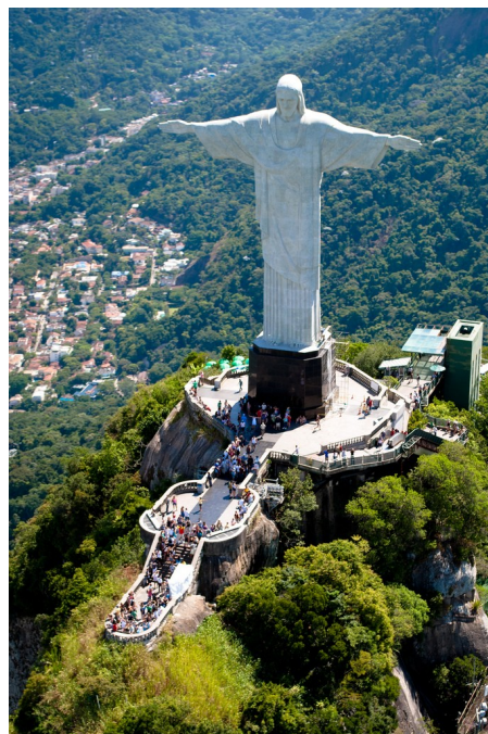
38-metrowy pomnik Jezusa Chrystusa Odkupiciela wzniesiony na szczycie granitowej góry Corcovado w Rio de Janeiro w Brazylii.

„Boże, Ojczy miłosierny, który objawiłeś swoją miłość w Twoim Synu Jezusie Chrystusie, i wylałeś ją na nas w Duchu Świętym, Pocieszycielu, Tobie zawierzamy dziś losy świata i każdego człowieka”. Zawierzamy Ci szczególnie ludzi młodych ze wszystkich narodów, ludów i języków. Prowadź ich bezpiecznie po zawiłych ścieżkach współczesnego świata i daj im łaskę owocnego przeżycia Światowych Dni Młodzieży w Krakowie. Ojczy niebieski, uczynź nas świadkami Twego miłosierdzia. Naucz nieść wiarę wątpiącym, nadzieję zrezygnowanym, miłość oziębłym, przebaczenie winnym i radość smutnym. Niech iskra miłosiernej miłości, którą w nas zapaliłeś, stanie się ogniem przemieniającym ludzkę serca i odnawiającym oblicze ziemi. Maryjo, Matko Miłosierdzia, módl się za nami Święty Janie Pawle II, módl się za nami Święta Siostrzo Faustyno, módl się za nami