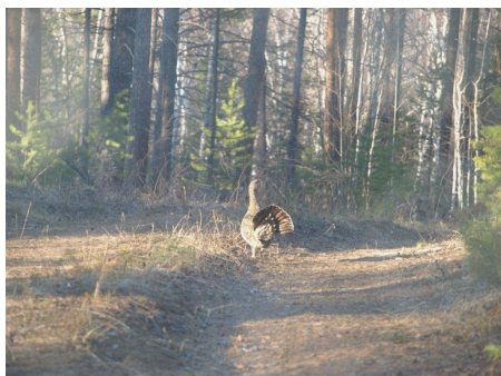
ZDJ. kura głuszca (St. Ostański)